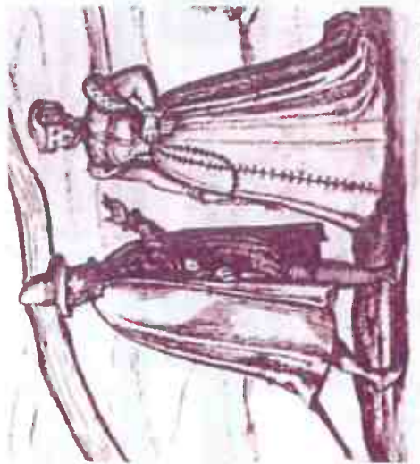
Plan aux personnages d'Avignon, 1575 (BM Avignon)

S ous la forme de conférences, d'ateliers ou de visites guidées, ces rendez-vous sont de nature multiple : rencontre avec un document « coup de cœur », aide à la recherche, initiation à la paléographie, visite d'exposition... et l'occasion aussi d'échanges fructueux entre archivistes et lecteurs, visiteurs, ou professionnels.